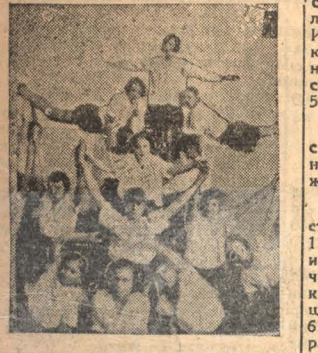
Спортучеба в химзавадской семилетке