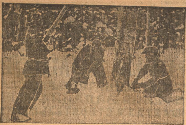
Лесозаготовки. Готовят лес для постройки рабочего городка на Барассе.