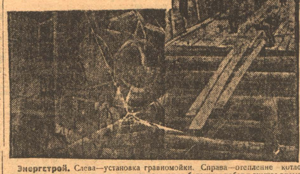
Энергострой. Слева—установка гравимойки. Справа—отделение котла ванао машинного отделения для производства бетонных работ в зимнее время.

Проводя разъяснительную работу за бережное отношение к машинам надо и привлекать к ответственности за их порчу. Машина—сердце нашего производства и ее нужно беречь. Я предлагаю создать сквозную ударную бригаду по механизированной добыче. Коллар.