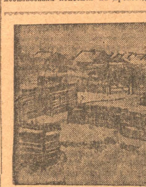
На снимке общий вид «Нахаловки». 400 слышим землянок приоткрылись, вросли в грязь раз оно химзавода Скужености, грязь, дурнопа, аписания. В таких тяжелых условиях приходится еще жить рабочим химзавода. На смену «Нахаловки» идет дома-коммуна (см. снимок). Но тут крайне меланхолия. Проблема «большого Кузбасса», наряду с задачами развития соц. индустрии требует решительного поворота внимания к культурно-бытовому строительству.

Газета «Большевистская Смена» с 15 октября по 1 января 1931 г. мобилизовала комсомол на производственный бой.