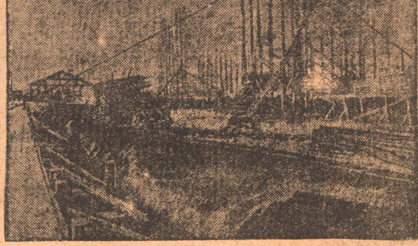
Конкострой. Установка колонн для оборудования тепляка по постройке 2-х коксовых батарей.