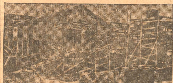
Заканчивается постройка завод по испытанию сапропелитов.