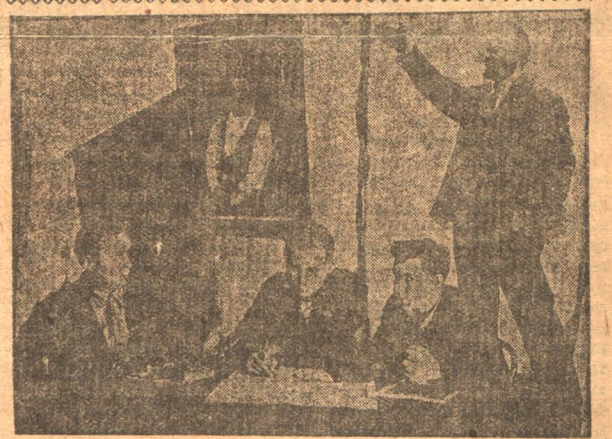
Мехзавод. Треугольник за разборкой рабочих предложений.