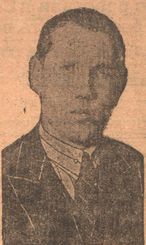
Тов. Сулимов Данил Егорович президентом ВЦИК назначен председателем Совнаркома РСФСР

план выполнен на 44,1 процента, по колхозному сектору по продовольственным культурам на 81,3 процента. Пшеницы сдано единоличниками на 15,8 процента и колхозами 70,9 процента к общей сумме хлебозаготовок. Из общего числа сданного хлеба по колхозному сектору 1615 тонн находятся в глубинных пунктах и под сохранными расписками. Кулацкие хозяйства из твердого задания 501 тонна выполнили лишь 229 тонн.