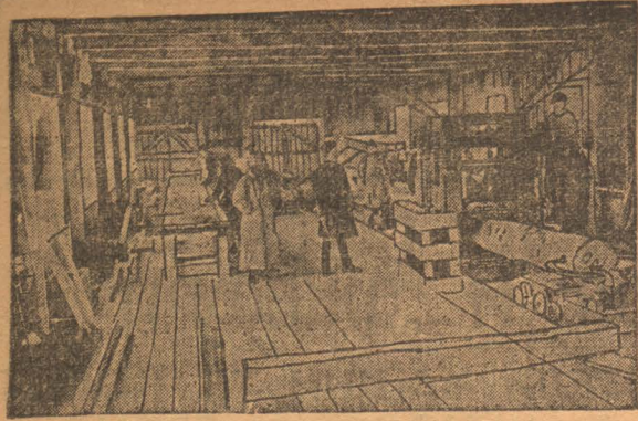
На площадке Кокострой установлена и пущена в ход лесопильная рама. Лесопилка за работой.