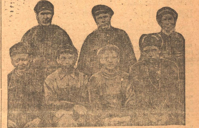
Ударная группа ЭМО Ц. Ш. закончившая переработку ламп по способу Костылева. Группа, взяв обязательство сделать к 18 октября 200 ламп, к 16-му сделала их 250 штук.

Ударная бригада мехцеха по выработке шахтерских лампочек перевыполнила свое задание. К 18 октября бригада обязана была изготовить 200 ламп. Изготовила же бригада к 16 октября—250 ламп.