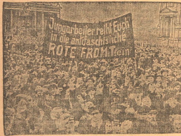
В ЛЮСТГАРТЕНЕ (Берлин) состоялась мощная антифашистская демонстрация, организованная германской коммунистической партией.