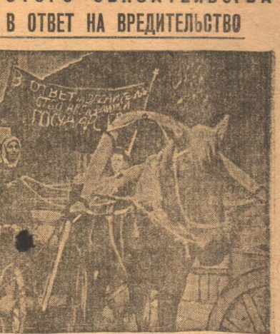
В ответ на вредительство единоличника Никульского сельсовета организовали красный обоз в 200 подвод. На снимке: единоличники привезли картофельным Климовского завода.