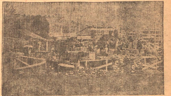
Общий вид постройки завода по перегонке сапропелитов

Лутугинский пласт 20 сентября также не выполнил задания.