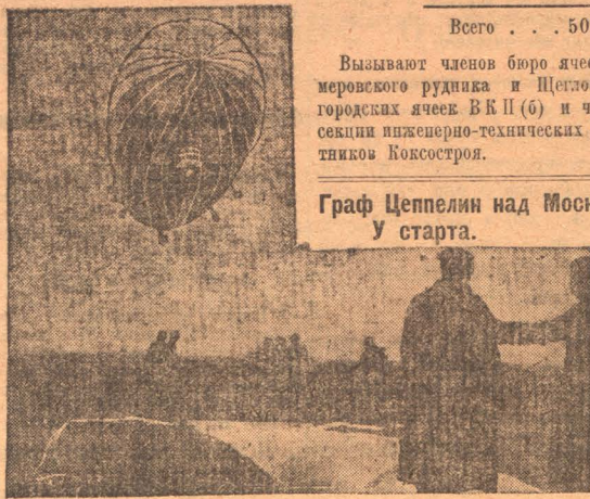
Граф Цепелин над Москвой. У старта.

Вызывают членов бюро ячеек Кемеровского рудника и Щеголовских городских ячеек ВКП(б) и членов секции инженерно-технических работников Коксостроя.