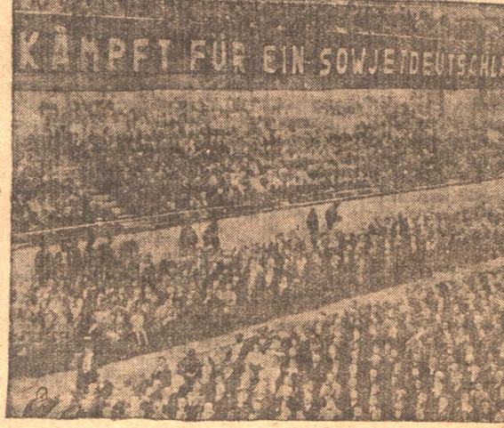
Предвыборный митинг компартии в Берлине.

Результаты выборов очевидно показывают, что трудовые массы Германии стоят перед коренным вопросом — фашизм или пролетарская диктатура, центром или союзная Германия. Этот вопрос найдет свое разрешение в предстоящих гигантских боях в которых готовятся пролетариат, под руководством компартии, организуя политические массовые забастовки.