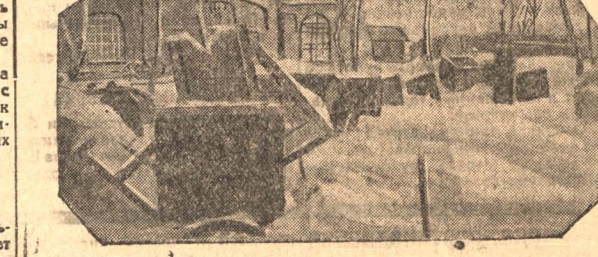
Старые вагонетки на Емельяуровской шахте, которые нужно сдать металлургическим заводам

На Ленинской буровой разведке неправильно используют рабочую силу. Лишние выходы рабочим не оплачивают, заставляют работать в день отдыха. Винованк этих недочетов не останавливаясь даже перед исключением из состоящей организации.