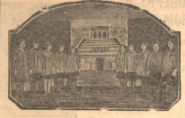
НА ФОТО: Постановка синей блузы клуба хиззавода, посвященная памяти Ильича.