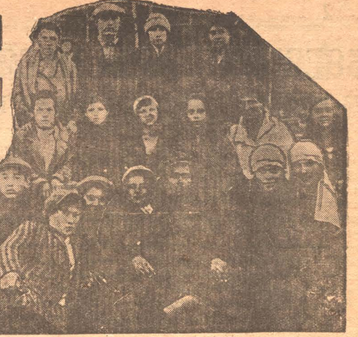
АГИТГРУППА ПО БОРЬБЕ С ПРОРЫВОМ. Коксострой.

11 СЕНТЯБРЯ ЧЕТВЕРГ 1930 год. № 207—(2281)