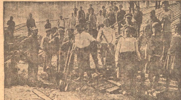
НА СНИМКЕ: Коллектив гордеткомиссии на воскреснике по постройке овощехранилищ.