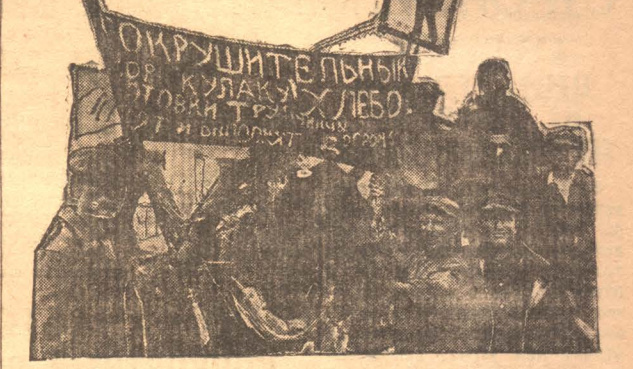
Крестьяне-единоличники дер. Грубычно, организовавшие красный обоз единого хозяйства. Этот обоз доставил около 20 тонн хлеба.

Дни озимого сева — считанные. Необходимо сельсовету повести работу в отстающих деревнях по-ударному. Надо использовать все средства и выполнить задание, закончив сев до 15 сентября. Выполняющим план не надо на этом останавливаться. Нужно бросить все силы на перевыполнение плана сева.