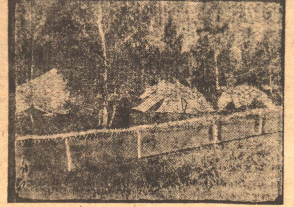
В лагерях переменников