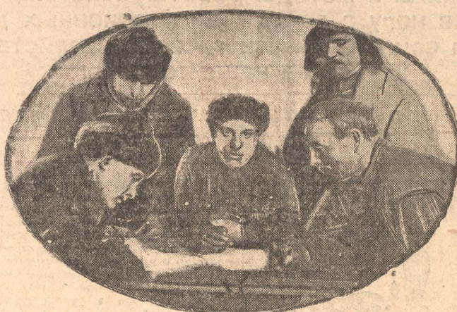
Ударники кузнечного цеха мехзавода заполняют анкеты.

(Обращение не вошло в ленин-ский номер по вине телеграфа, задержавшего доставку телеграммы)