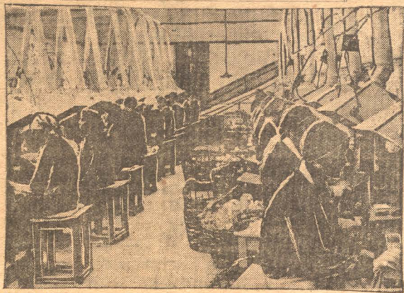
НА СНИМКЕ: ударный цех (паяльный) на коксеновой фабрике „Возрождение“ в Симферополе.

Снижена стоимость планового питания в столовых ЦРК со вчерашнего дня. Вместо 18 рублей пансионеры будут платить теперь 14 рублей. Одновременно с этим отменяется продажа обедов помесячно.