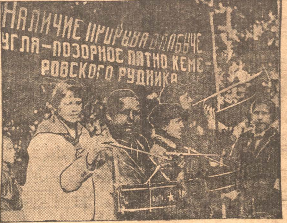
НА СНИМКЕ: Демонстрация пионеров Кемеровского рудника вступивших в бой за уголь.