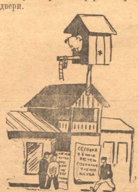
Таково лицо культурно-массовых организаций на Прокопьевском руднике. Это положение вытекает из общего неверия прокопьевцев в творческие силы рабочего класса, которое объективно является правым уклоном, хотя и не имеет этого руководители рудника и шахт. Прикрывают они это ворохом трескучих резолюций или оголяют, как в случае с клубом имени Артема.