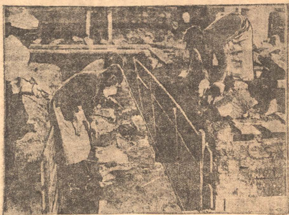
НА СНИМКЕ: Забутовка жоглована.