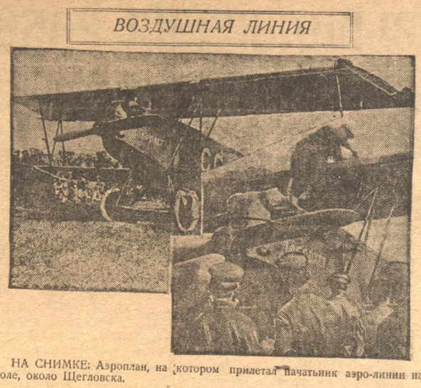
НА СНИМКЕ: Аэроплан, на котором прилетал пачатыник аэро-линии на поле, около Щегловска.

Проектировка и разбивка водопроводной сети начнется не раньше июля, так как нет окончательного проекта нового социалистического города.