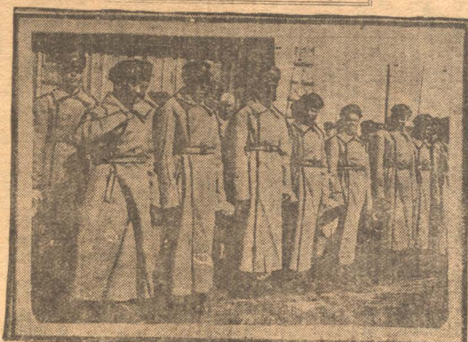
НА СНИМКЕ: Призывники в строю.