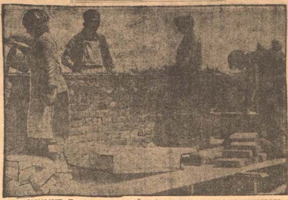
НА СНИМКЕ: Выпускники стройуча на кладке детдома на химзаводе.