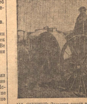
НА СНИМКЕ: Засыпка семян в дисковую сеялку в коммуне «Комсомолец».