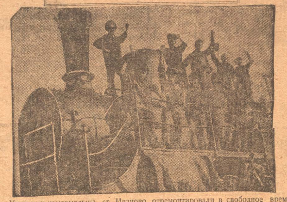
Ударники-комсомольцы ст. Иваново отработали в свободное время паровоз в подарок съезду.