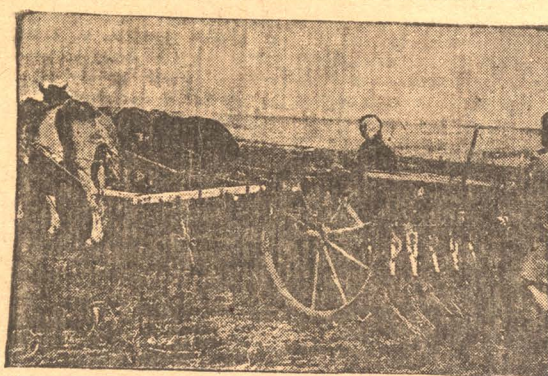
Коммунары „Комсомоля“ (Топкинский район) помогли единоличникам провести сев.