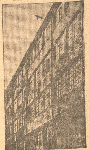
НА СНИМКЕ: Корпус вновь вы- строенной кондитерской фабрики в Москве.