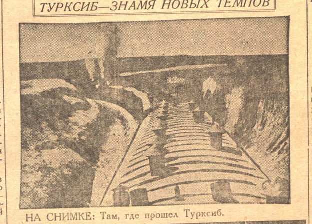
НА СНИМКЕ: Там, где прошел Турксиб.

МОСКВА, 18. На местах возник во- прос, как облагать хозяйство великим отказавшихся от надела, отводимого им взамен отчужденного в колхоз (ра- нее принадлежавшего им) земельного участка. Наркомфин СССР разъясняет, что если с начала учетно-налоговой кампании от земельного надела отка- зались все хозяйство, то платить сель хозяином за этот оставленный надел он не должно, хозяйство, не вступи- вшие в колхоз и отказавшиеся от вновь отведенной земли, освобождаются от сельскохозяйственных налогов, ко- гда этот отказ вызван уважительными причинами.