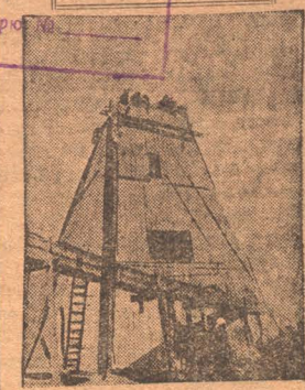
НА СНИМКЕ: Копер первой коковой шахты в Прокопьевске.