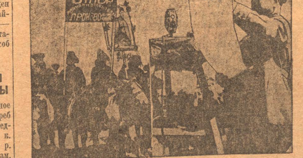
НА СНИМКАХ: Слева—рабочие-казанки, строители Турксиба на смычке рельсов уга с севером, Справа—Штаб зачитывает доклад о смычке южного и северного участка пути.