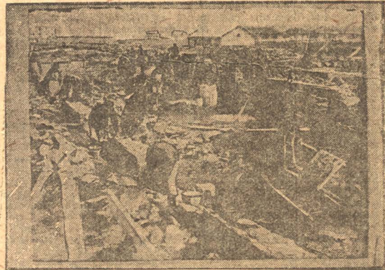
НА СНИМКЕ: Работы по постройке домов для рабочих на химзаводе.