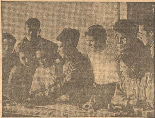
НА ФОТО: Занятия Осовиахимовского батальона на Кузнецкстрое.