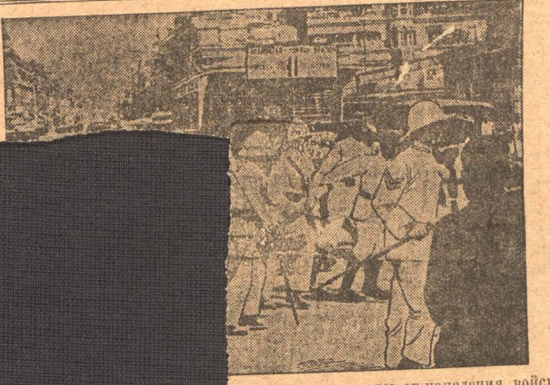
НА СНИМКЕ: Войска и полиция при разборке баррикады.

группы, защищаясь от нападения войск, возвели баррикады. Во время столкновения было убито 6 рабочих и 60 тяжело ранено.