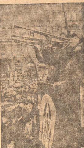
НА СНИМКЕ: Фанфаристы дают сигнал о начале митинга во время всегерманского дня рабочей молодежи, состоявшегося 21 апреля в Лейпциге