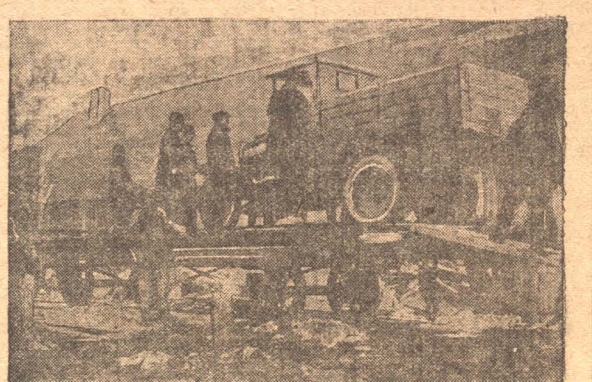
Кокосстрой получил партию грузовых автомобилей, которые будут доставлять стройматериалы на строительство. НА ФОТО: Выгрузка автомашин.