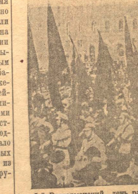
5-й Всегерманский день рабочей молодежи, состоявшийся 21 апреля в Лейпциге, превратился в боевой смотр революционных сил рабочей молодежи. НА СНИМКЕ: Берлинский комсомол демонстрирует.