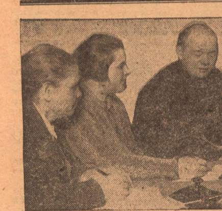
Женщины-директора и работницы обсуждают пятилетний план развития народного хозяйства.