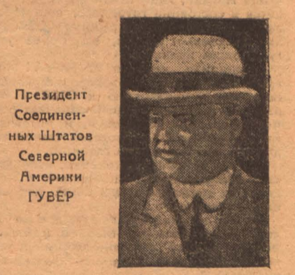
Президент Соединенных Штатов Севернорной Америки ГУВЕР

(См. статью "Признание стучится в окно", стр. 2)