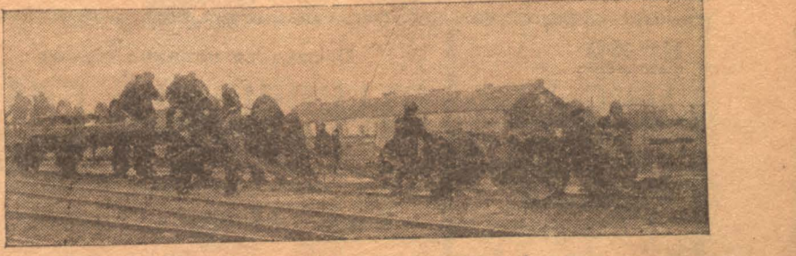
Воскресник топкинских железнодорожников в пользу посевной кампании