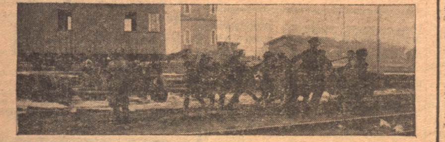
Воскресник топкинских железнодорожников в пользу посевной кампании

Науку и технику — на борьбу с нищетой и угнетением деревенской жизни. Поднимем урожай крестьянских полей! Развернем социалистическую перестройку деревни!