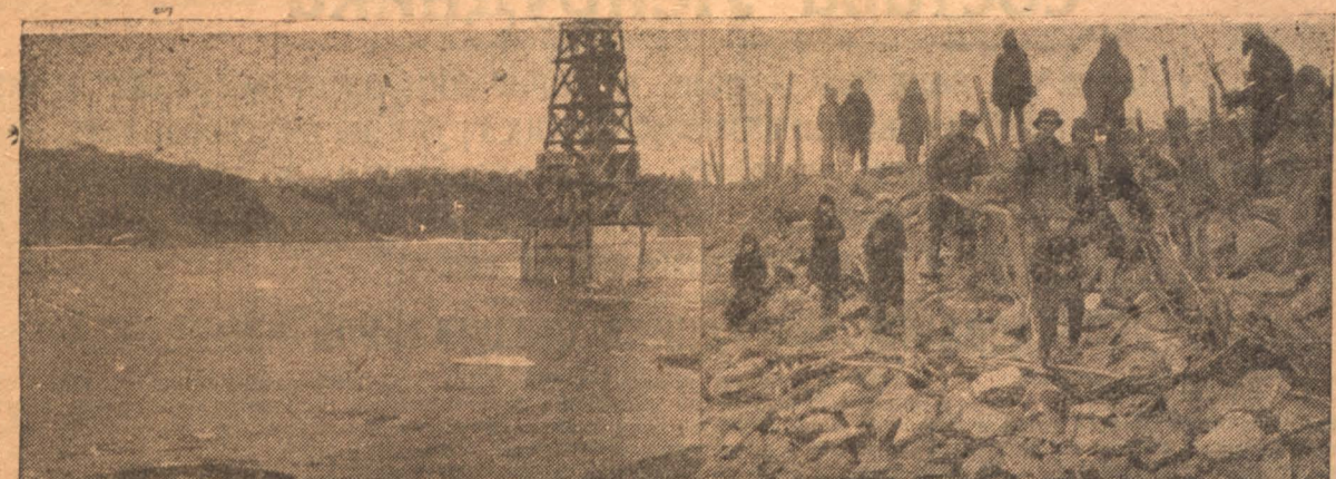
По реке несутся льдины. Слева—рабочие крепят берег у водокачки.

Собравшиеся на рабочую конференцию решили считать ее закончившейся. Они поручили президиуму окрисполкома сделать выводы из тех материалов, которые собрали обследователи. В. В.