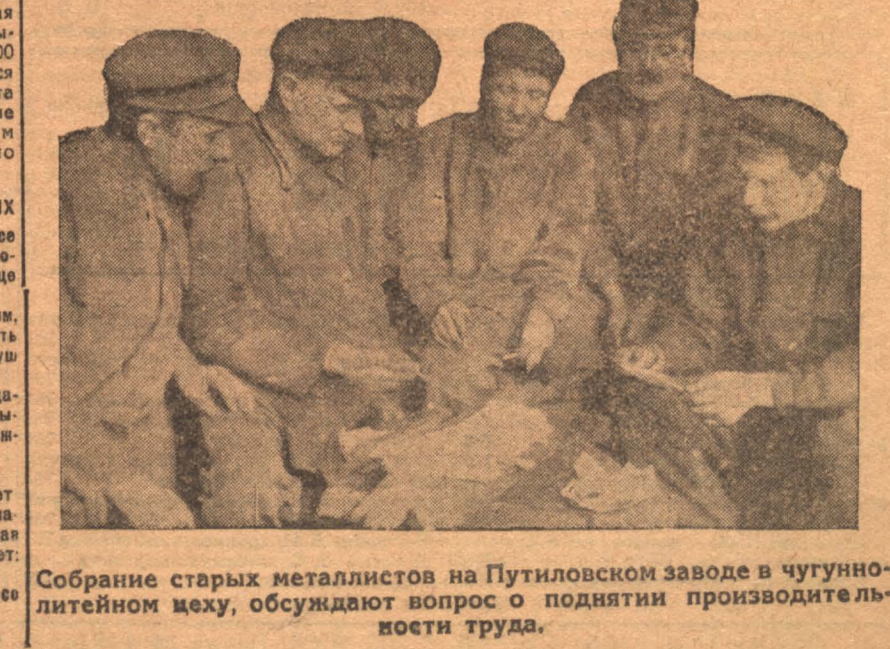
Собрание старых металлистов на Путиловском заводе в чугунолитейном цеху, обсуждают вопрос о поднятии производительности труда.