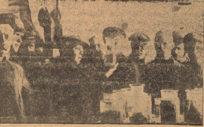
Делегаты 3 окружного съезда советов на ветеринарной выставке во дворце труда

Только при укреплении смычки и развитии самостоятельности может быть выполнен хлебозаготовительный план».