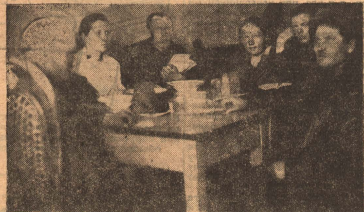
Делегаты съезда за обедом

В дальнейшем нам необходимо обратить самое серьезное внимание на больничное строительство. Опыт прошлых лет показал, что в этом строительстве у нас царит хаос и неразбериха. Красная комиссия при окрздраве наши планы и проекты по постройке больниц беспорядочно калечила. В результате получалась чепуха. Финансирование строительства до сего времени не налажено. Постройки, которые нужно было закончить еще в 1927 году, приходится достраивать в 1929