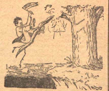
Прямим сообщением... в болото

Резюмируя прения, тов. Кубяк констатировал некоторое запоздание в Сибири массового развертывания предвесенних мероприятий. Темп работы надо усилить, тем более, что естественные экономические возможности Сибири вполне позволяют это.