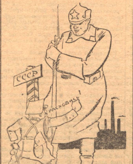
Но подействует ли он?