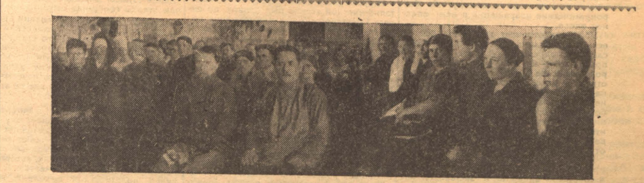
На окружной батрацко-бедняцкой конференции

Московским советом подписан договор с американской фирмой на постройку жилых домов в Москве. Договор поступил на рассмотрение Совнаркома. В ближайшее время уполномоченными Моссовета в Америке будут начаты переговоры на предоставление стройкредита.