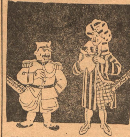
ЛОУРЕНС(Чкавцауачану):—Вам, генерал, даже гримироваться не надо...

Профессиональная зависть, или спецы по восстаниям