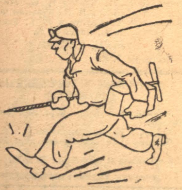
Запальщики носят, высунув язык. Разве это работа?

Техника безопасности и трудовая дисциплина, это -- две вещи, о которых не имеют понятия работники ленинской шахты имени Карла Маркса. Запальщики, вместо того, чтобы работать полную смену, они свою работу выполняют в два часа. За это время они заряжают от 40 до 60 скважин. Зарядка производится наспех, без достаточной проверки и осторожности. При взрывах от такой запалки нужный результат не получается. Таким образом, масса динамита тратится напрасно. Кроме того, такая работа запальщиков создает большую опасность для шахтеров.