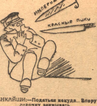
ЧАНКАЙШИ.—Податься куда... Вперу лезвочку закрывать