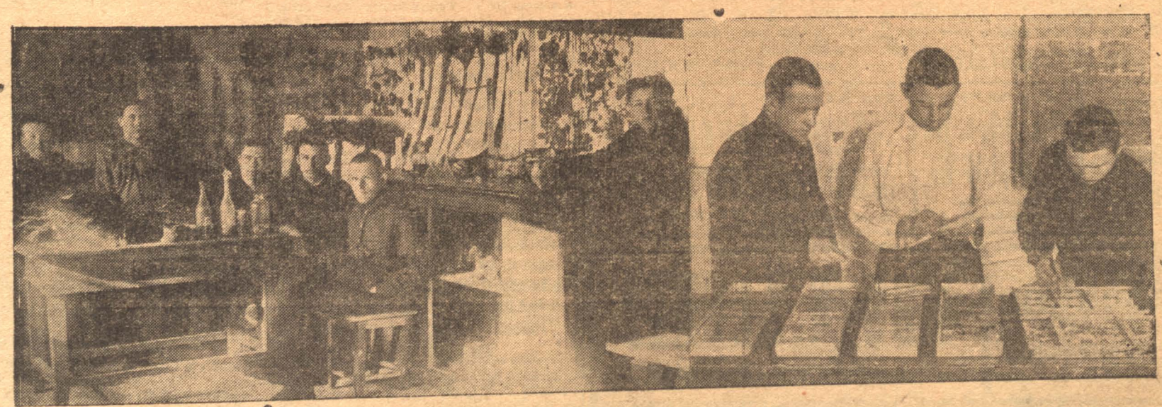
НА СНИМКАХ: 1. Лаборатория, где ученики испытывают всхожесть семян 2. Уголок кабинета по сельскому хозяйству

Посевная кампания в Бачатском районе проходит при активном участии школы крестьянской молодежи. Тридцать восемь учеников работают, уполномоченными рика по посевной кампании в селах района. В школе организована лаборатория по определению всхожести семян. Такие же лаборатории ученики школы крестьянской молодежи организовали в селах и деревнях при школах первой ступени и выделили для них руководителей из своей среды.