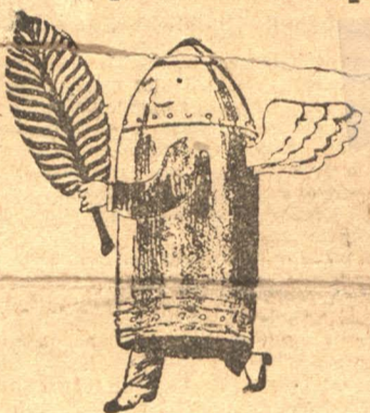
Ангел мира в 1929 году