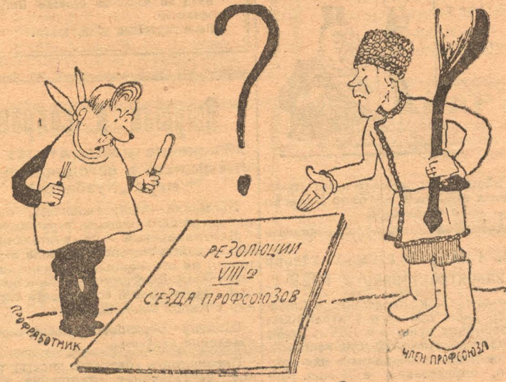
С чем ее едят?