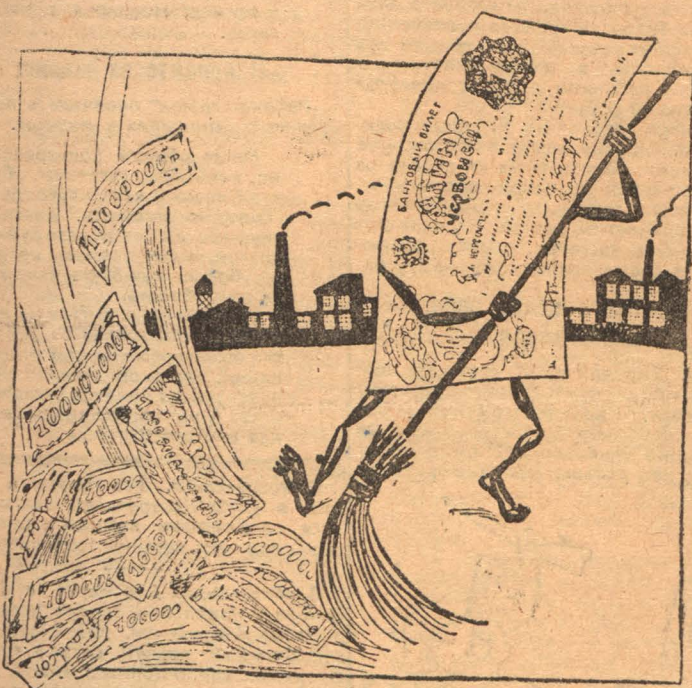
Червонной метлой по бумажному хламу