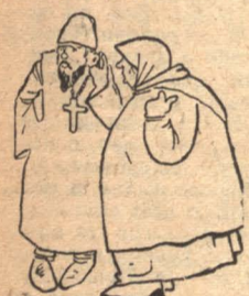
— Вы знаете, я своими собственными глазами видела в клубе Томского двух шахтеров... Какое нахальство...

Если вы захотите почему-либо провести свободный вечер в клубе Томского, то вы должны запастись терпением и быть готовым ко всякого рода приключениям. Словом, считайте, что вы увидите много „интересного“, достойного приносов и кабаков.