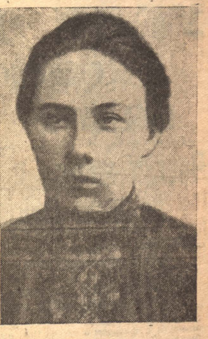
60 лет жизни, 35 лет революционной борьбы

На заре социал-демократического революционного рабочего движения в Петербурге, на Шлиссельбургском тракте, появились в воскресных и иных школах, до самообразования преданные делу народного просвещения молодые девушки — учительницы. Среди них была Надежда Константиновна Крупская.