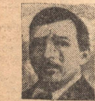
ТОМСКИЙ... Не верю я, что это клуб

О, какое печальное лицо сделал бы тов. Томский, заглянув хоть на минуту в свой клуб, в Ленинский очаг культуры, отдыха и разумных развлечений! Сколько бы горячих слов произнес он, призывая нас к борьбе за рабочий клуб, где отдыхают после тяжелой утомительной работы, где учатся для того, чтобы стать культурными, знающими и... вежливыми! Какой бы завязался бой за уничтожение клубных беспорядков, за чистоту, за тишину, за хорошего рабочего зрителя!