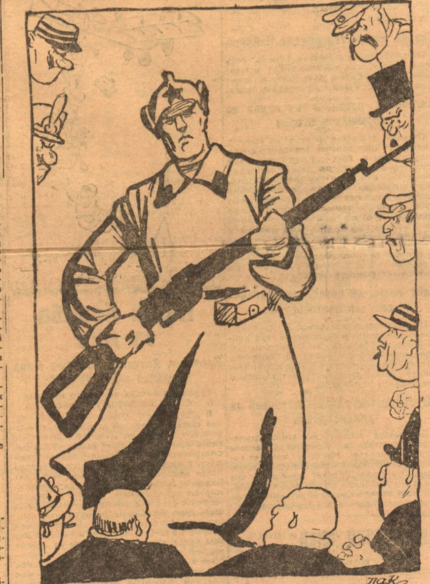
Красная армия — верный страж СССР