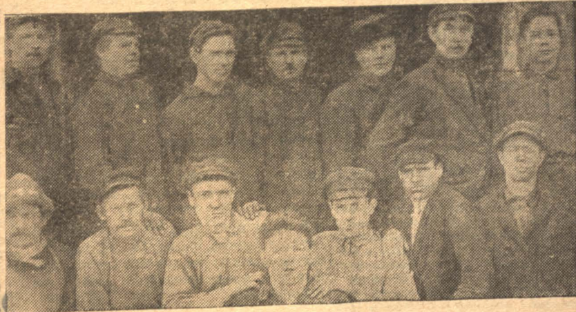
Новые подписчики „Кузбасса“; слева — топкинцы (подписались на 3 г.), справа — гурьевцы (годовые подписчики)