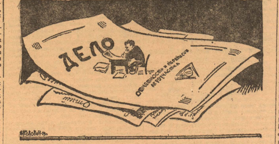
«Поле» деятельности многих наших агрономов

К посевной кампании совхоз «Гигант» (Северный Кавказ) предполагает засеять 48111 гектаров. Из этого количества 36.000 гектаров будет вспахано под зябь. Вся эта громадная площадь будет сбсеменована в течение 10 дней. Для этой работы потребуется 500 тракторов и 300 сенокосилок. Сейчас в совхозе имеется 250 тракторов и 50 сенокосилок, хорошо отремонтированных и готовых к «бою». Недостающее количество машин должно прибыть в конце февраля. Потребуется отряд трактористов в 1060 человек (на две смены). При совхозе проводятся тракторные курсы, которые выпускают к весне 500 трактористов и 150 трактористов имеется штатных.