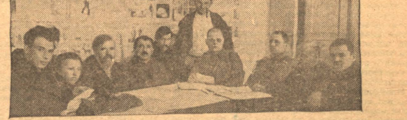
Щегловский горизбирком подводит итоги переизборной кампании

Аэро-гидро—метеорологическая экспедиция—экспедиция по изучению воздушных течений, вод океана и погоды.