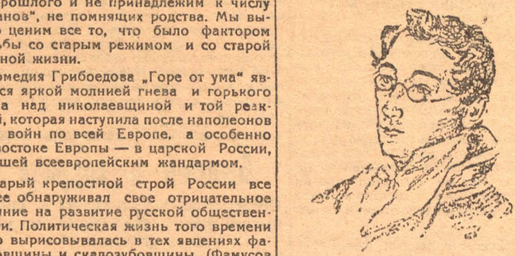
А. С. ГРИБОЕДОВ

К СТОЛЕТИЮ СО ДНЯ СМЕРТИ (11 фев.) А. С. ГРИБОЕДОВА