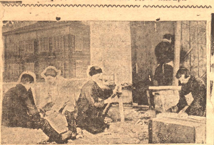
НА СНИМКАХ: Дом, переданный под детприемник, и работы по его оборудованию.

Профорганизации, как и во всякой другой кампании, занимают раз навсегда установившиеся места, последние место в Белово профорганизация только еще собирается подрабатывать мероприятия помощи безпризорным. В остальных районах даже и не собираются. Активно работают во всех районах только делегаты.