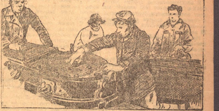
Ученики школы горпромуча за изучением врубовой машины.