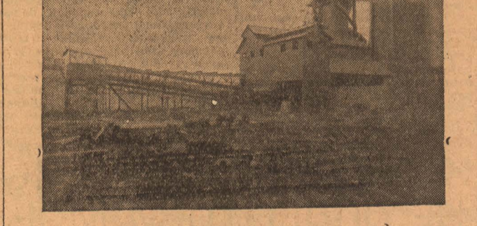
Проект доменной печи