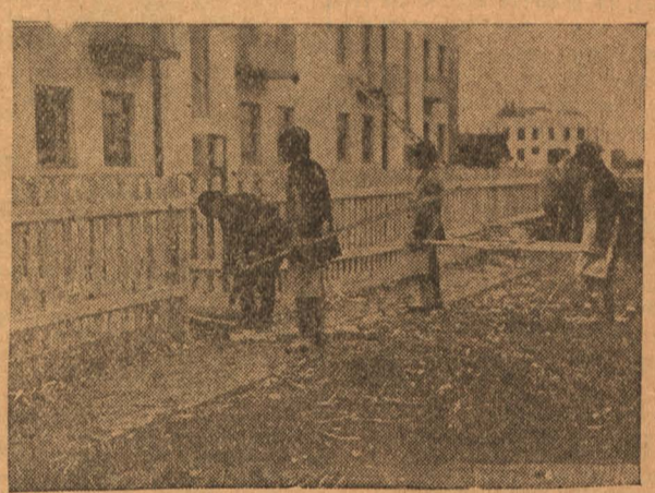
Разбивка палисадника возле выстроенного дома окружкома.