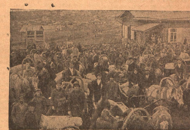
В ответ на убийство тов. Радкина, крестьяне организуют красные озы. 29 сентября в П.окопьевск прибыл 1-й обоз, привезший 545 центов хлеба.

В районе, помимо 2-х пристанционных сыпных пунктов, находящихся в г. Ленинске, имеется еще 10 глубинных пунктов. Между тем как сводки (пятидневки) охватывают