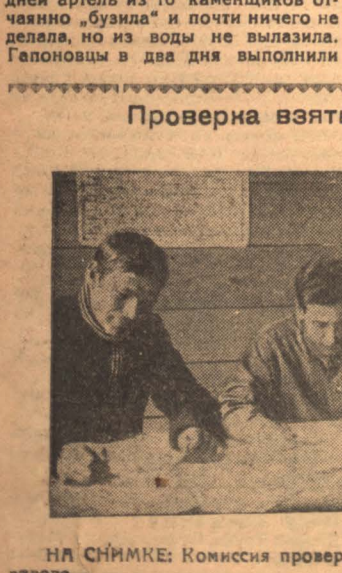
НА СНИМКЕ: Комиссия проверяет выполнение соглашения на зимовке.

все, что нужно, а их в артели было только 10 человек; тогда и первая артель устыдилась и начала работать.