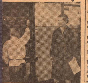
НА СНИМКЕ: Занятия в школе химзавода.