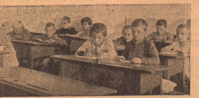
В школах города начались занятия НА СНИМКЕ: Ученики I группы школы № 3 на уроке