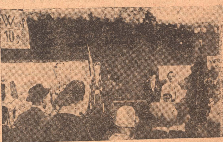
Происходивший 25/VIII—29 г. в Реберге под Берлином красный день культуры и спорта превратился в боевой праздник революционной классовой борьбы под руководством партии.

НА СНИМКЕ: Инсценировка во время демонстрации.