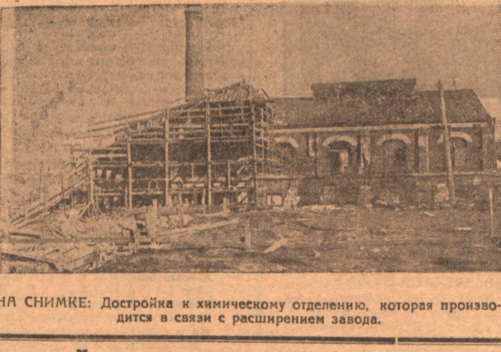
НА СНИМКЕ: Достройка к химическому отделению, которая производится в связи с расширением завода.